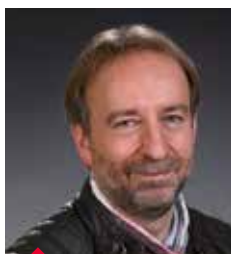
OURTH Patrick CACTUS