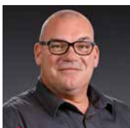
FRANZ Dirk CARLEX GLASS LUXEMBOURG