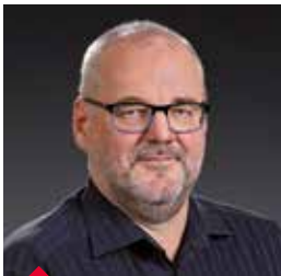
REUTER Georges CREOS