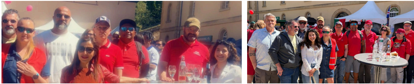
↪ Participation aux festivités de l'OGBL du 1er mai pour venir écouter les discours de Nora Back sur, l'absence total de dialogue social et le manque de respects du gouvernement dans un contexte où nos droits sociaux son en danger !

Nous étions présents aussi le 5 mai à 7h devant le Ministère du travail pour participer à l'action coup de poings pour des meilleurs salaires qui permettent de vivre décemment ! Marc Spautz, Ministre du Travail, n'était pas ravi de nous voir ;-)