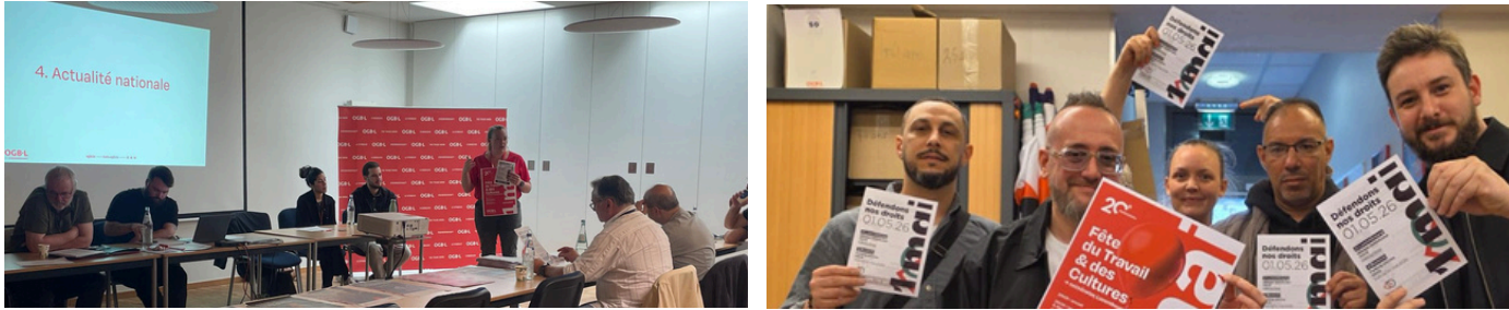
Discussions et mobilisations pendant nos réunions syndicales, lors notamment de notre Direction syndicale du Syndicat Services & Energie, et lors de la réunion de travail avec la délégation OGBL de ONET Security ↪