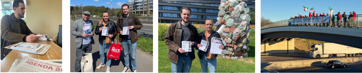
↪ Distribution de tracts pour mobiliser les collègues du gardiennage, notamment avec la délégation OGBL chez Brink's et participation aux actions autoroutes avec nos collègues des autres secteurs, pour des salaires dignes !

Nos militants du Gardiennage sont sur le terrain pour défendre les intérêts des salarié.e.s !