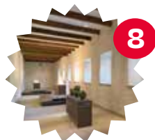
Déambulateur Exposition Lucien Wercollier