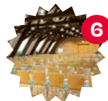
Salle Edmond Dune Shamama