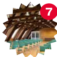
Salle José Ensch Olé