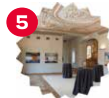
Chapelle Moi, je suis Rosa / Eu sou Rosa