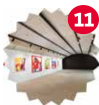
Salle Michel Delvaux Letzvote