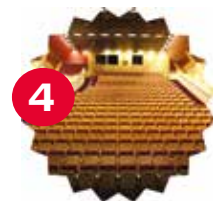
Salle Robert Krieps Grandes-Illusions – Jay Witlox