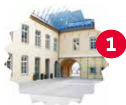
Agora Marcel Jullian Atelier poterie et modelage