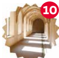
Cloître Lucien Wercollier Ateliers & exposition «Elles nous racontent»