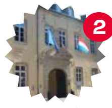
Cour d'entrée Manège des 1001 nuits