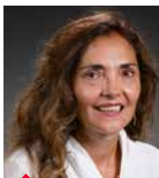
OLIVEIRA FERREIRA ÉP. FERRAZ GOMES CORREIA Marina Isabel HORNBACK BAUMARKT LUXEMBOURG