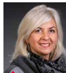
MONTE Fabia FONDATION LÉTZEBUERGER KANNDUERF