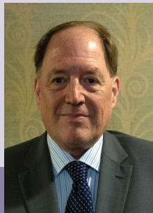
James K. GALBRAITH

Il est également membre de l' Accademia dei Lincei , la plus ancienne académie scientifique de l'Europe.