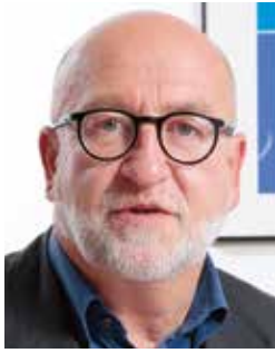
André Roeltgen Präsident des OGBL